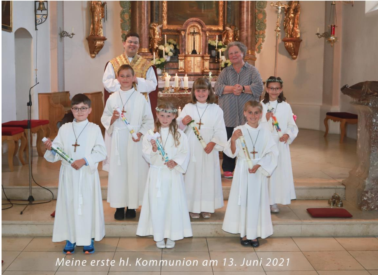
Meine erste hl. Kommunion am 13. Juni 2021

Die Kinder bekamen im Anschluss gesegnete Metallkreuze umgehängt, als Zeichen der Erinnerung, dass Jesu am Kreuz für uns gestorben sei.